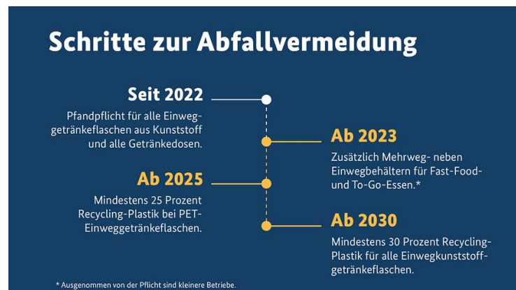
Abbildung 1: Geplante Maßnahmen zur Vermeidung von Abfall der deutschen Bundesregierung. https://www.bundesregierung.de/breg-de/themen/klimaschutz/mehrweg-fuers-essen-to-go-1840830

Die neue Regelung soll zur Vermeidung von Abfall dienen und gilt für gastronomische Einrichtungen mit mehr als 80 qm Verkaufsfläche sowie mehr als fünf Mitarbeitenden.